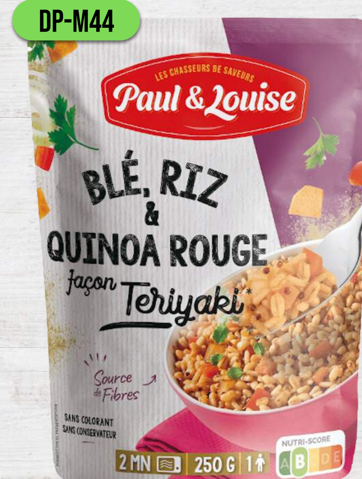
PŠENICA, RYŽA A ČERVENÁ QUINOA S TERYAKI OMÁČKOU

RAVIOLI 300G VAJEČNÉ CESTOVINY 50% PLNKY BEZ FARBÍV BEZ UMELÝCH DOCHUCOVADIEL