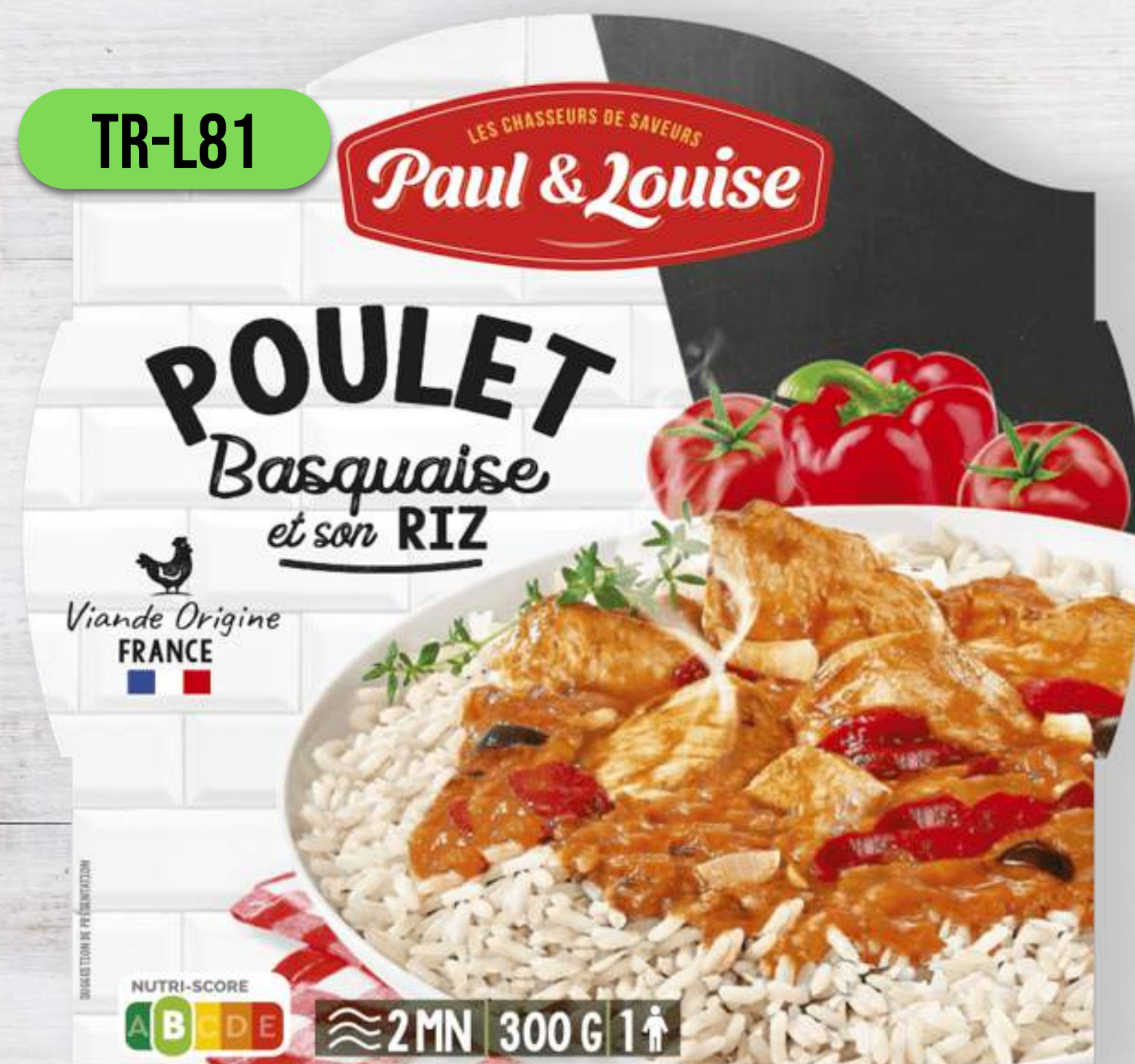
KURA PO BASKICKY S RYŽOU