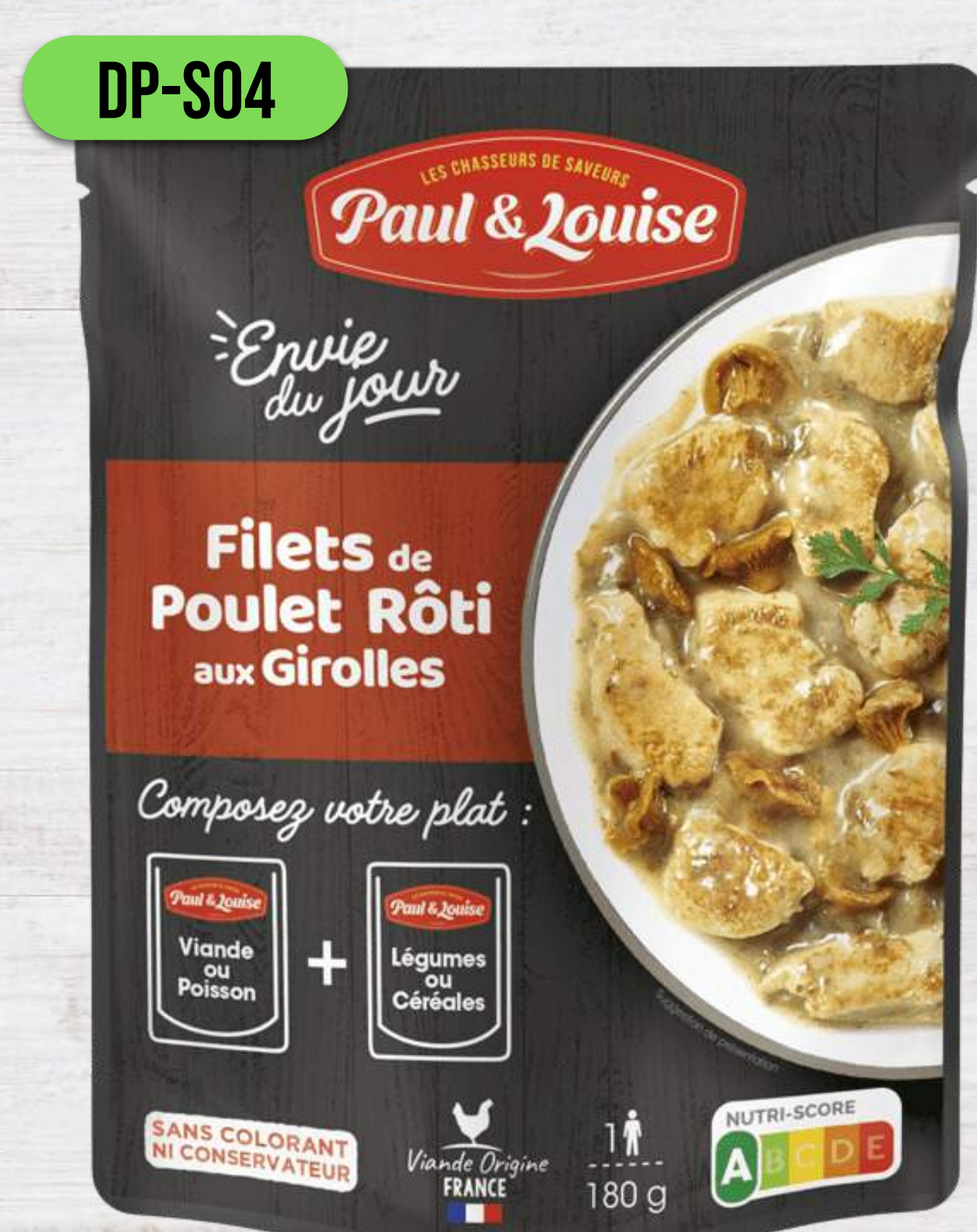
GRILOVANÉ KURACIE FILETY S KURIATKAMI