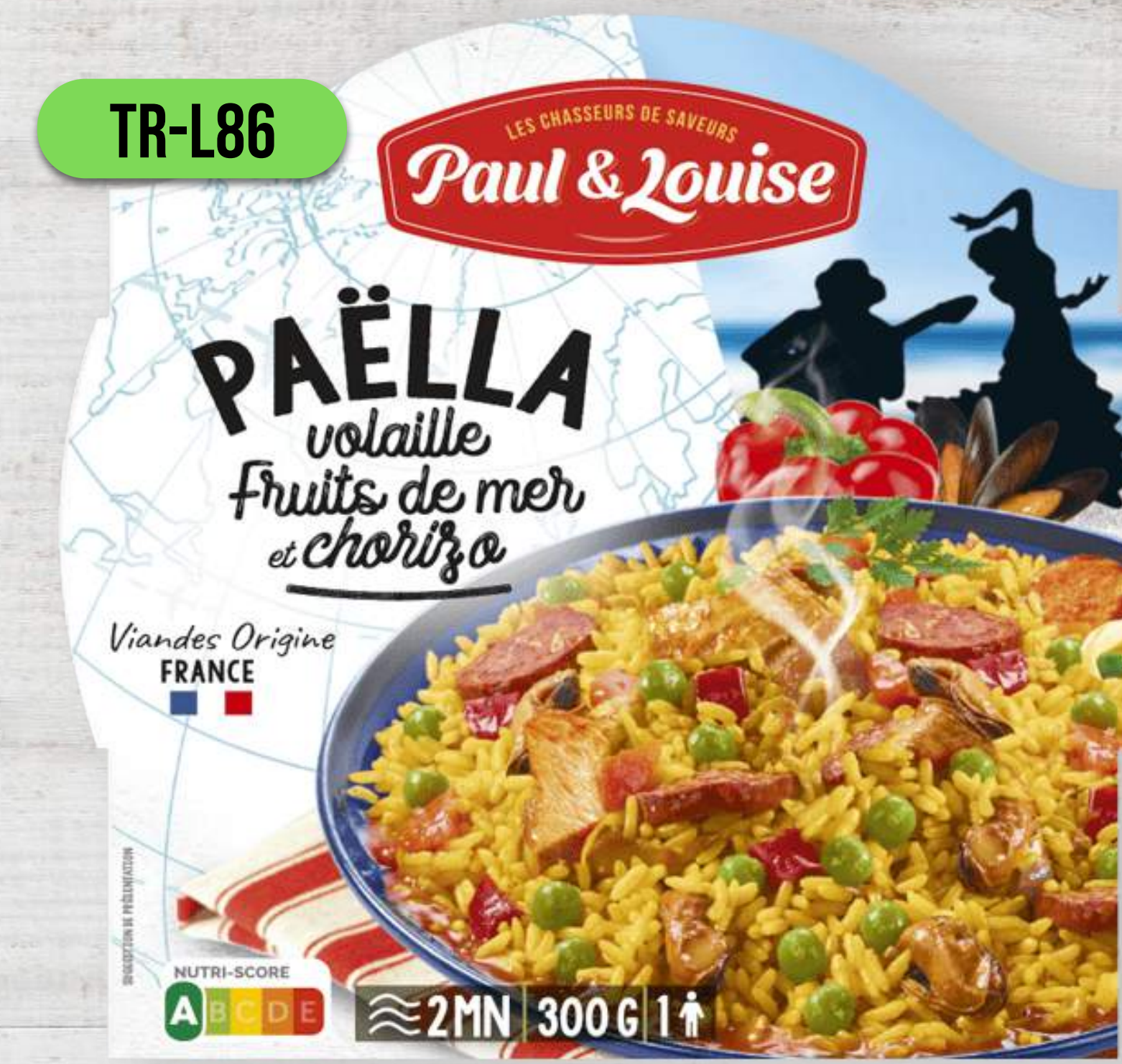
PAELLA S KURACÍM MÄSOM, PLODMI MORA A CHORIZOM