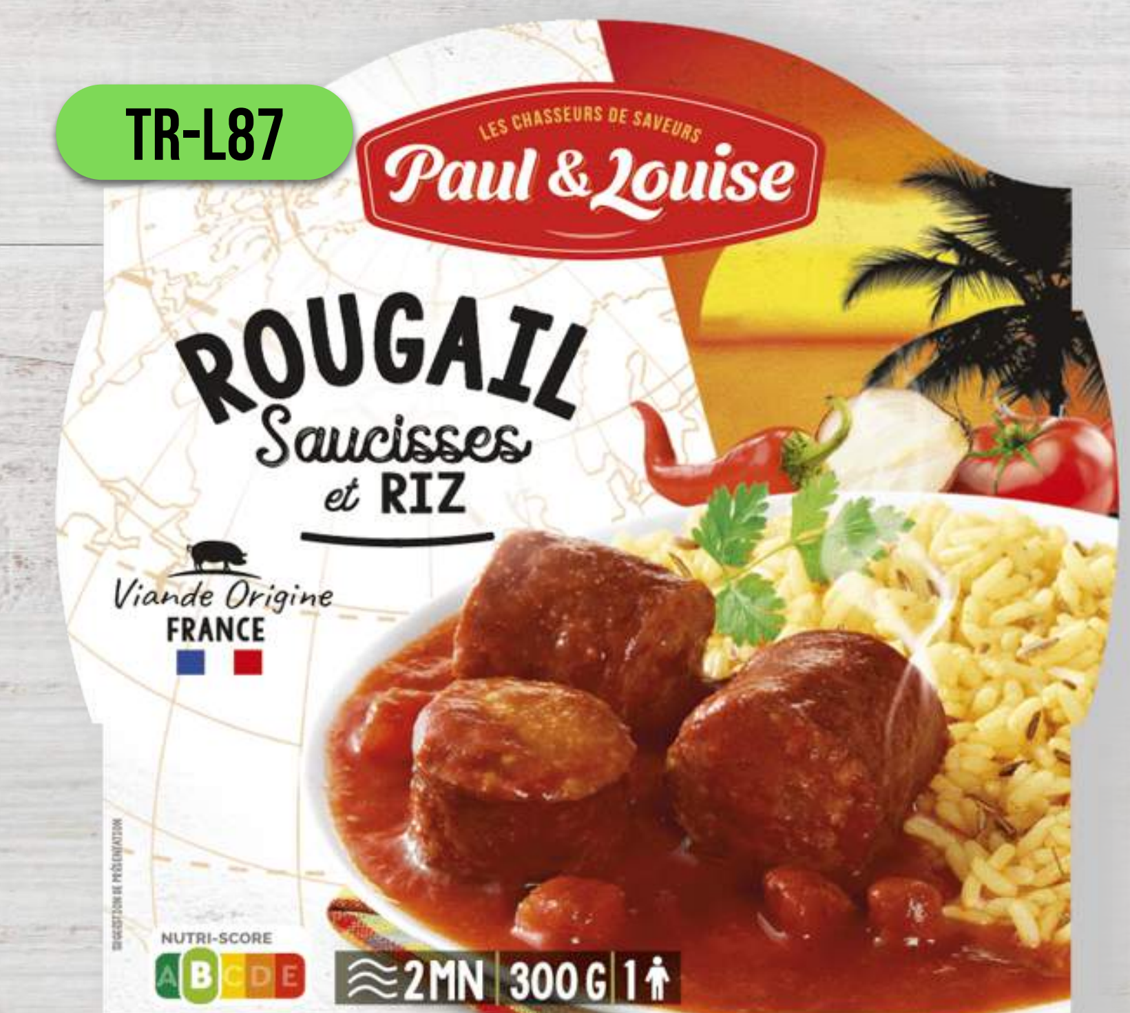
ÚDENÉ KLOBÁŠKY ROUGAIL S RYŽOU