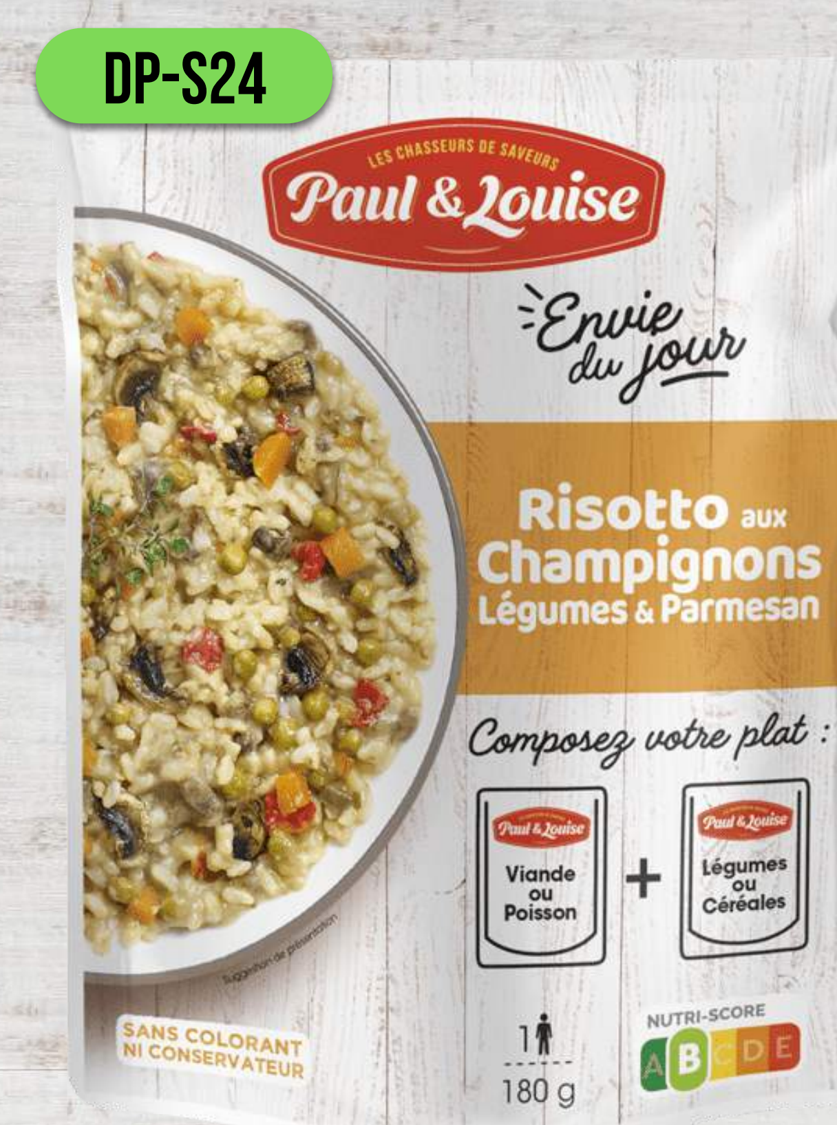
RIZOTO S HUBAMI, ZELENINOU A PARMEZÁNOM