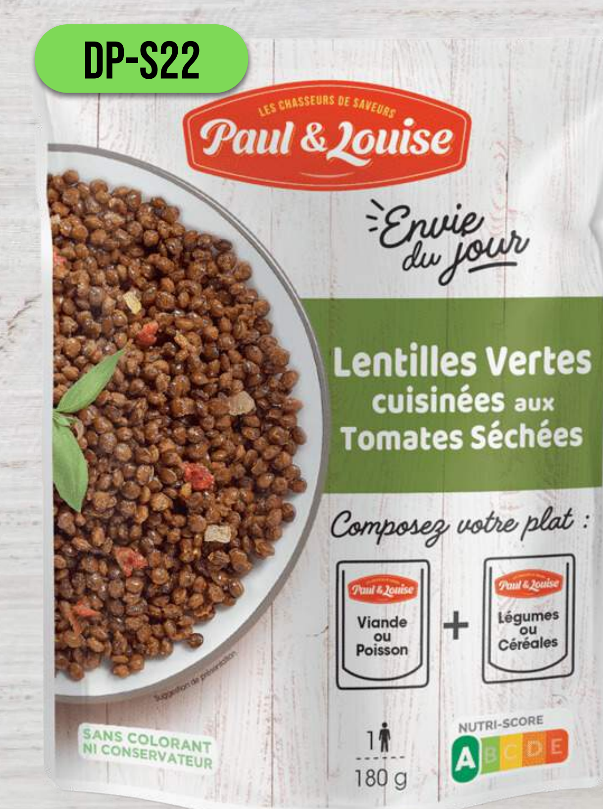
ZELENÁ ŠOŠOVICA SO SUŠENÝMI PARADAJKAMI