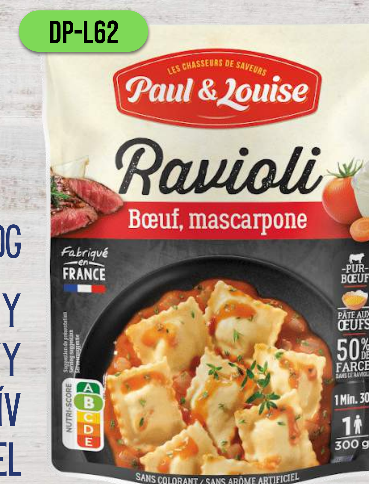
RAVIOLI S HOVÄDZÍM MÄSOM A MASCARPONE

RAVIOLI 300G VAJEČNÉ CESTOVINY 50% PLNKY BEZ FARBÍV BEZ UMELÝCH DOCHUCOVADIEL