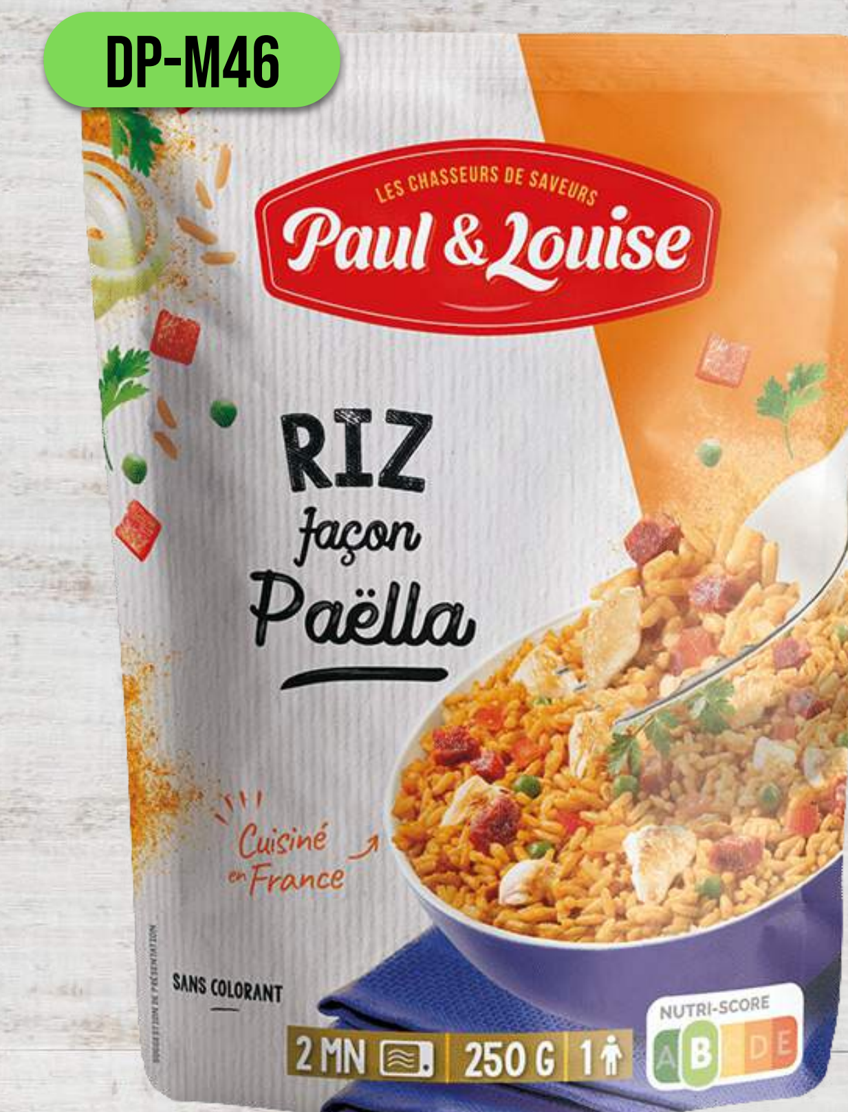
RYŽA V ŠTÝLE PAELLA

DOYPACK VRECKÁ 250G A 300G DO MIKROVLNKY AJ DO HRNCA