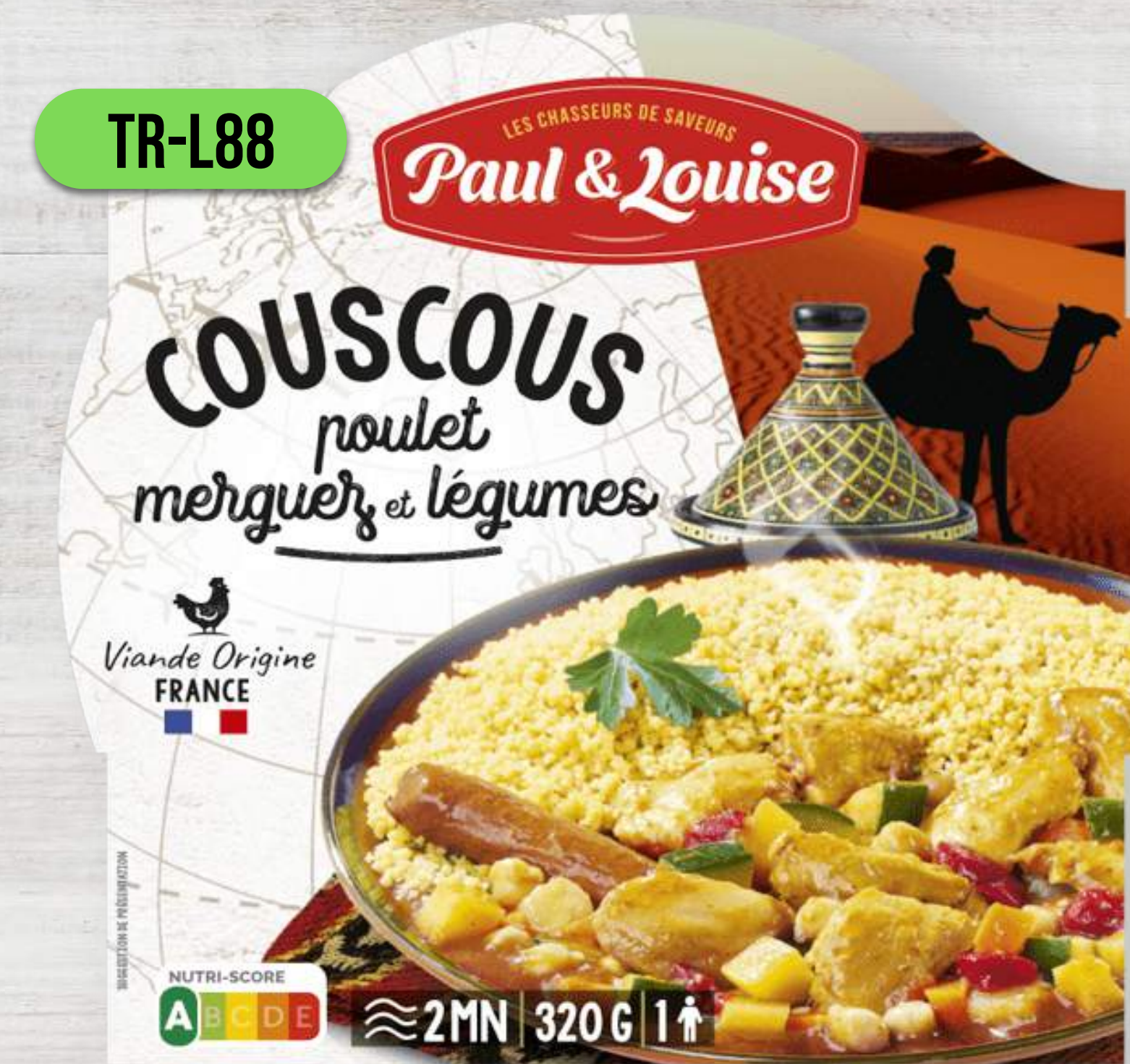
KUSKUS S KURACÍM MÄSOM, PIKANTNOU KLOBÁSOU A ZELENINOU