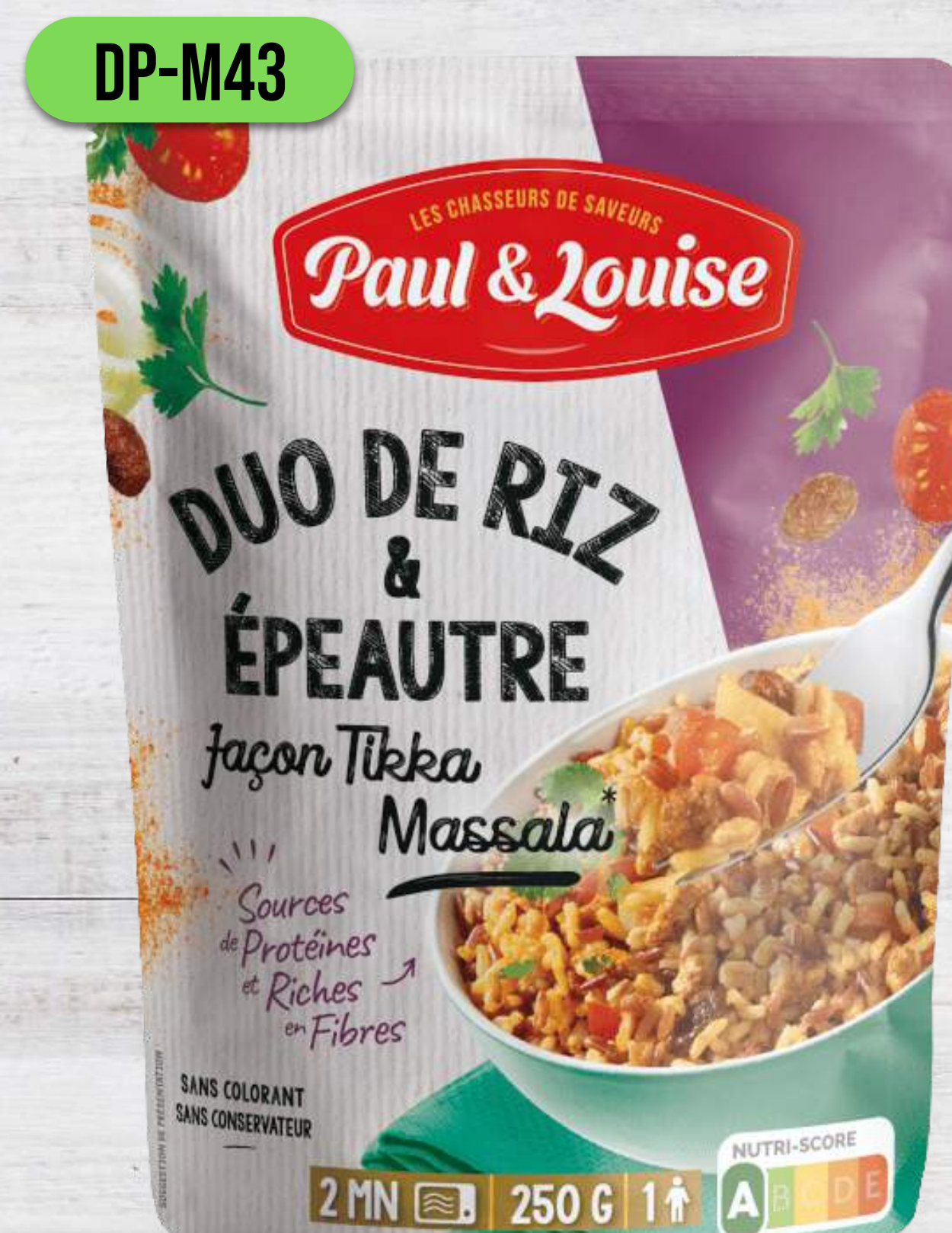
DUO RYŽE A ŠPALDY NA SPÔSOB TIKKA MASSALA