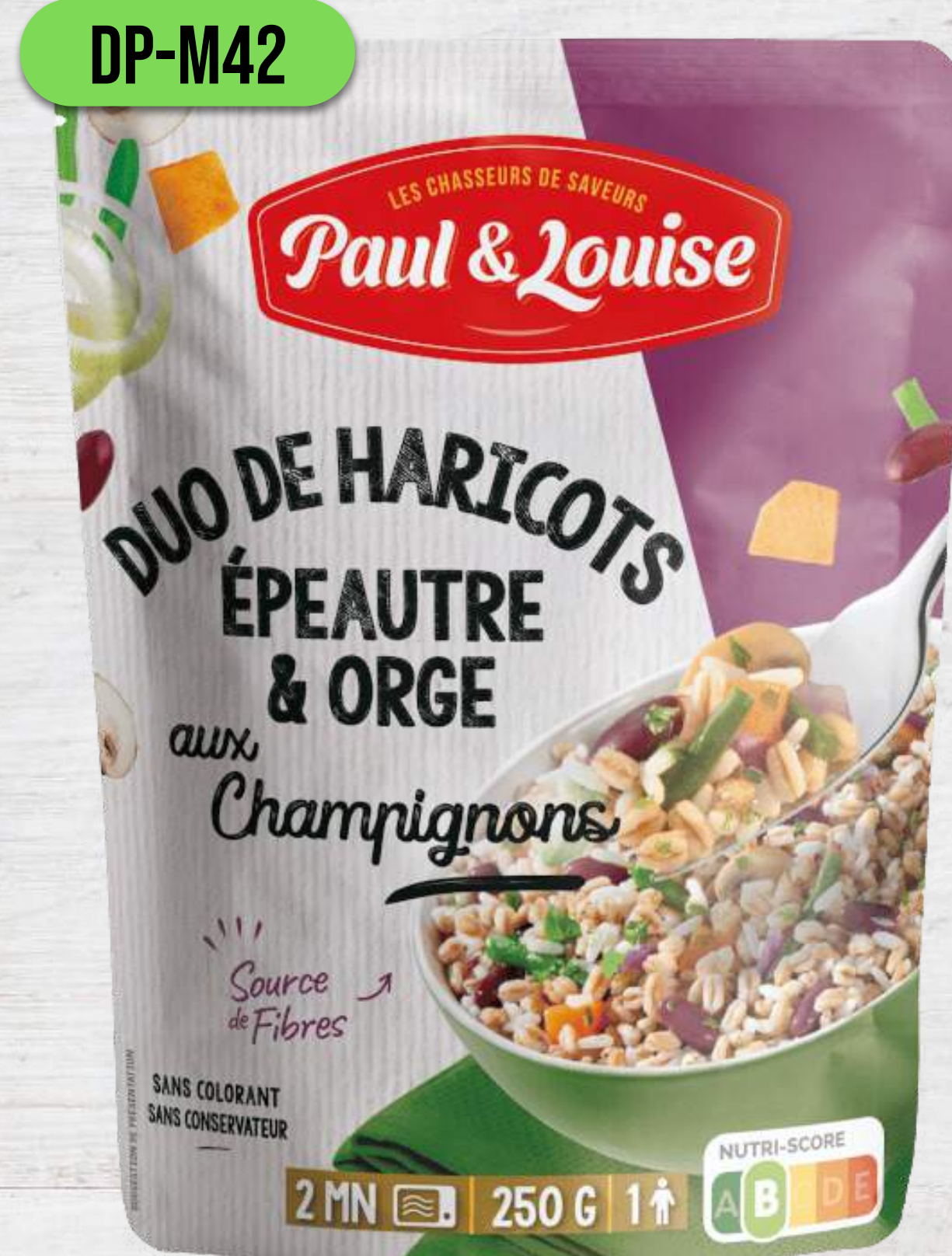
DUO FAZULIEK A OBIĽNÍN SO ZELENINOU A ŠAMPIŇÓNMI

DOYPACK VRECKÁ 250G A 300G DO MIKROVLNKY AJ DO HRNCA