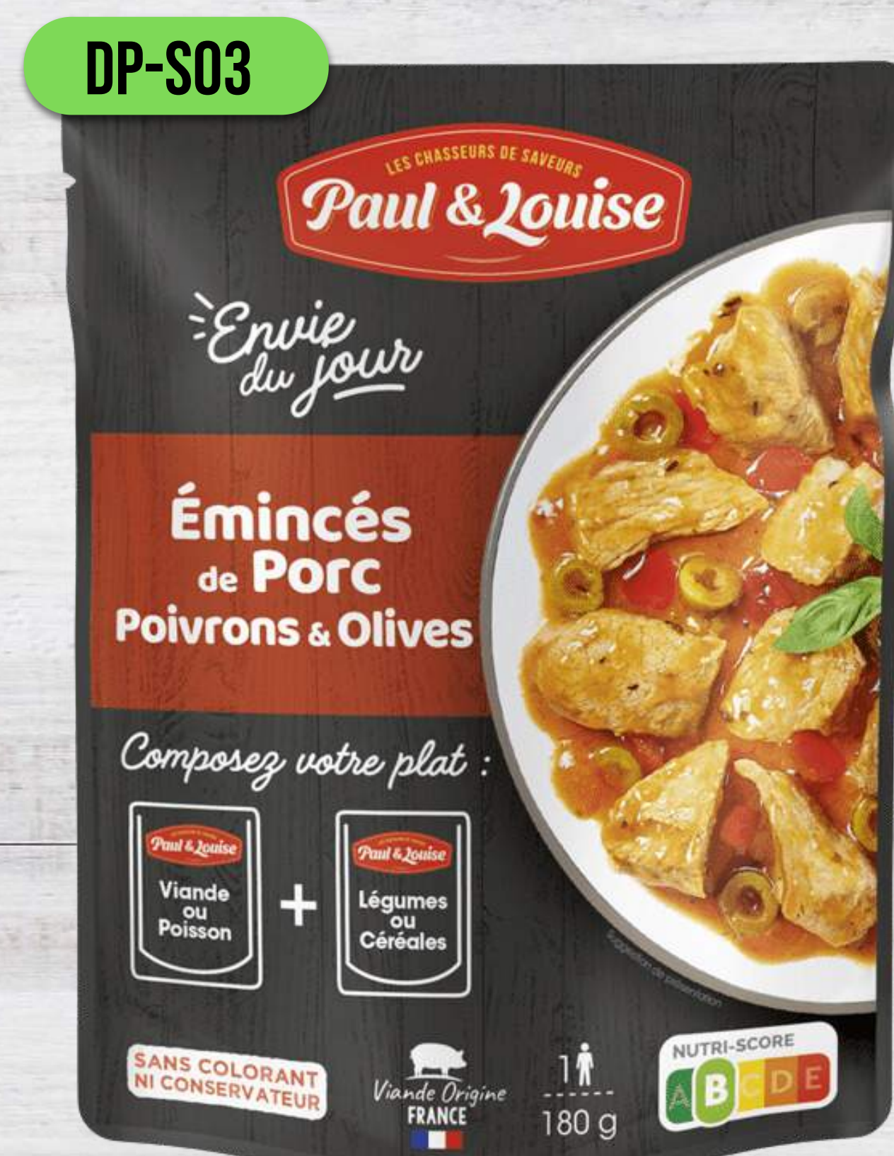
BRÁVČOVÉ S ČIERNYM KORENÍM A OLIVAMI