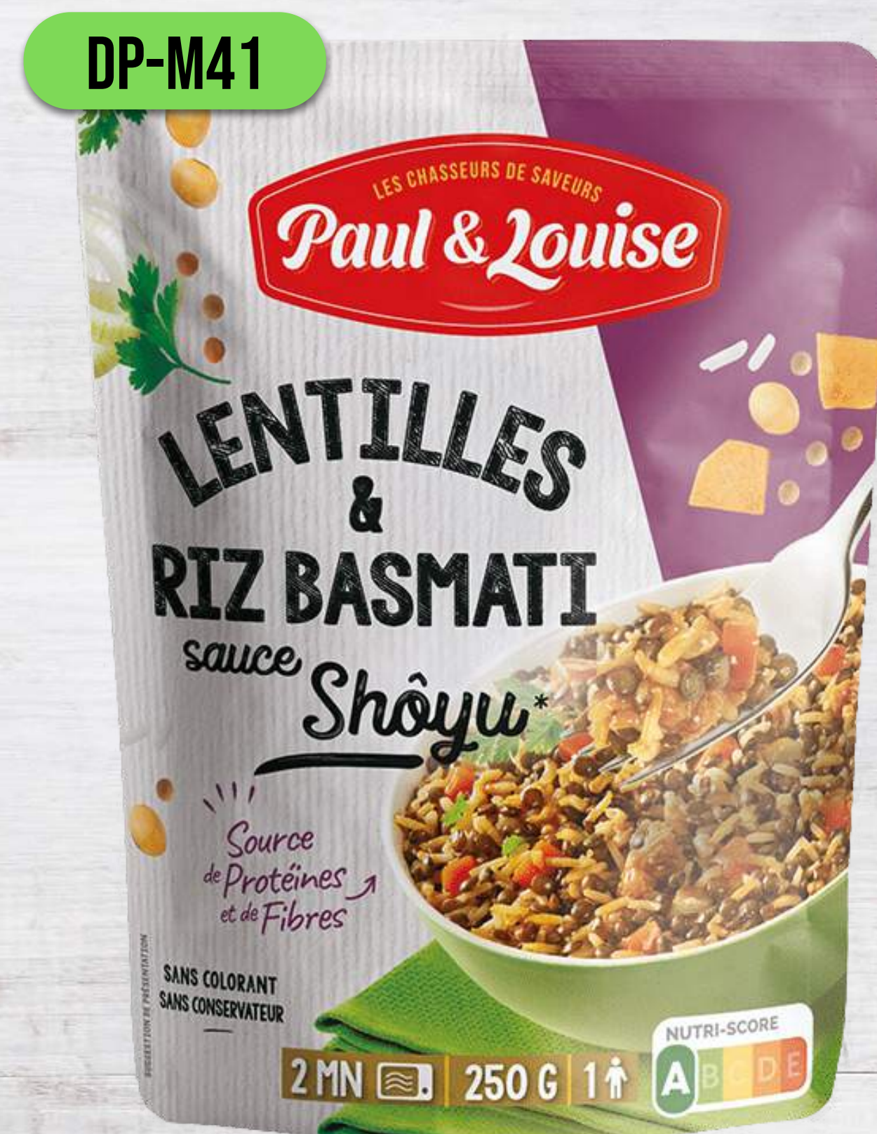
ŠOŠOVIČA S BASMATI RYŽOU A SÓJOVOU OMÁČKOU