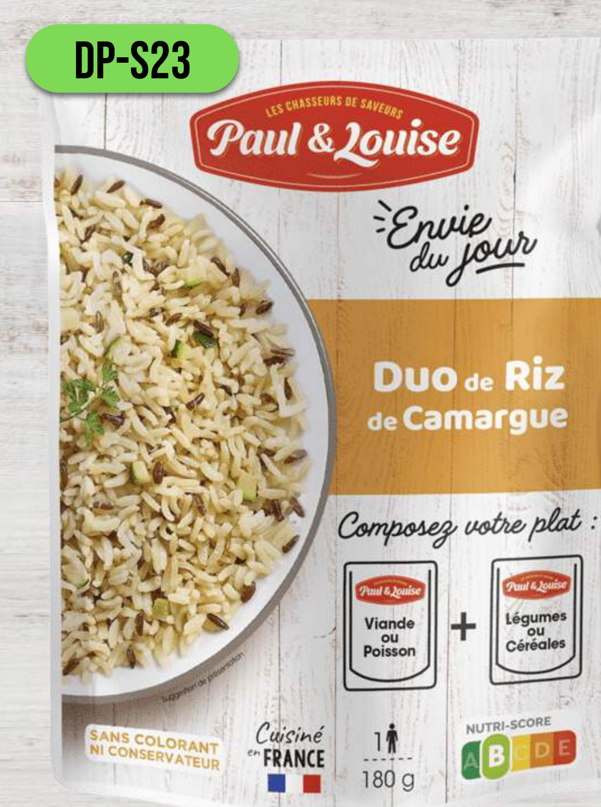
DUO RYŽE Z CAMARGUE