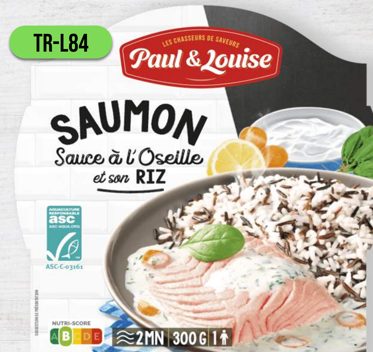
LOSOS SO ŠŤAVELOM A RYŽOU