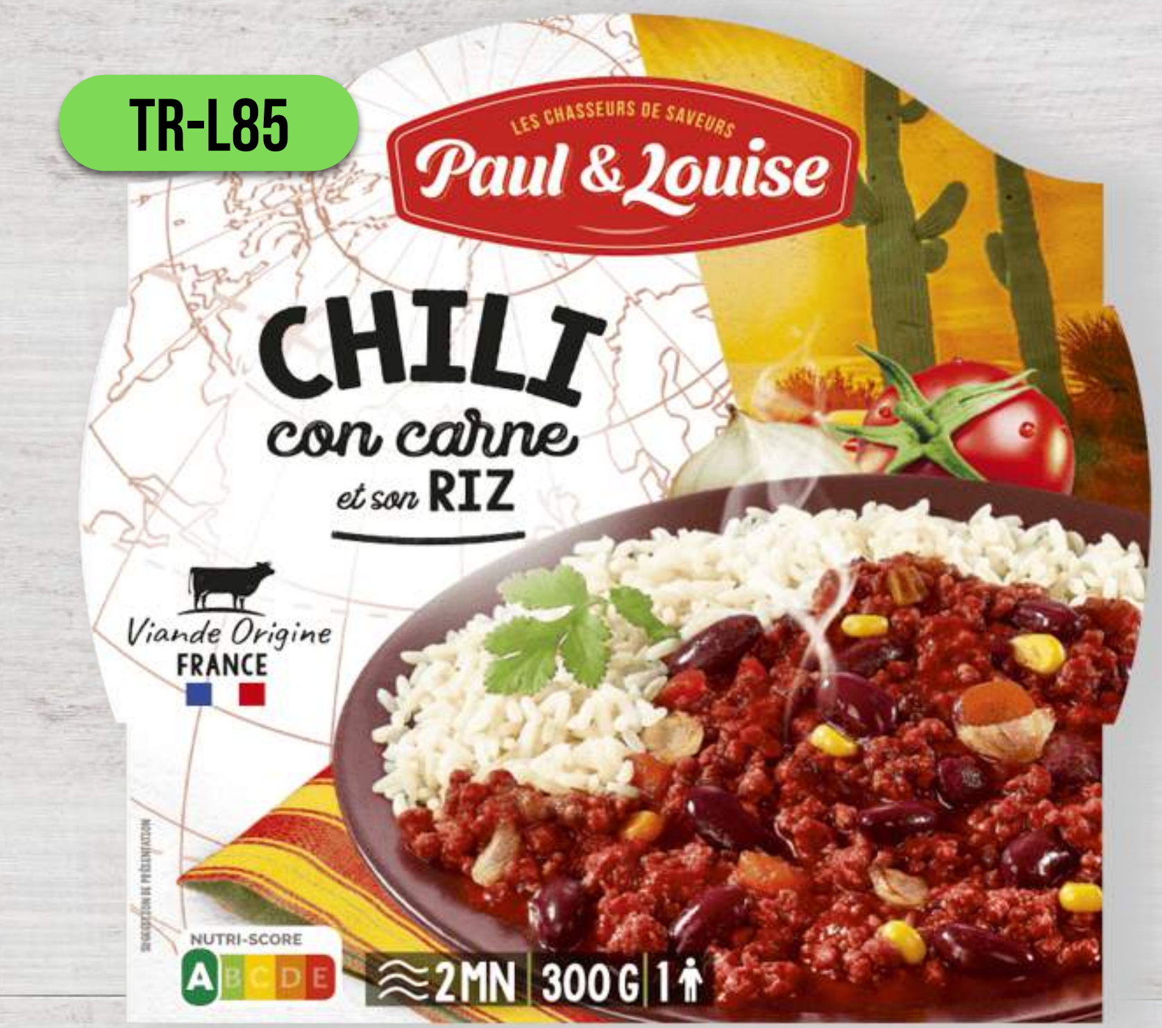
CHILLI CON CARNE S RYŽOU