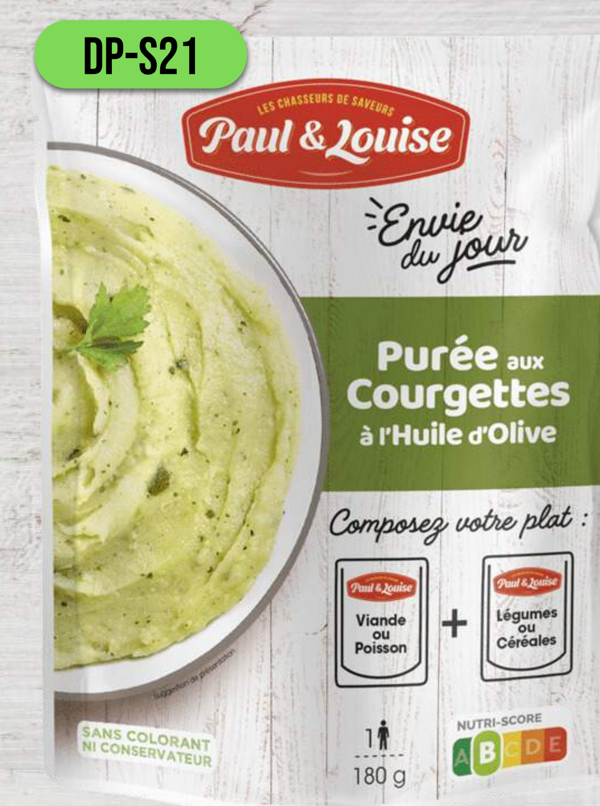
CUKETOVÉ PYRÉ NA OLIVOVOM OLEJI