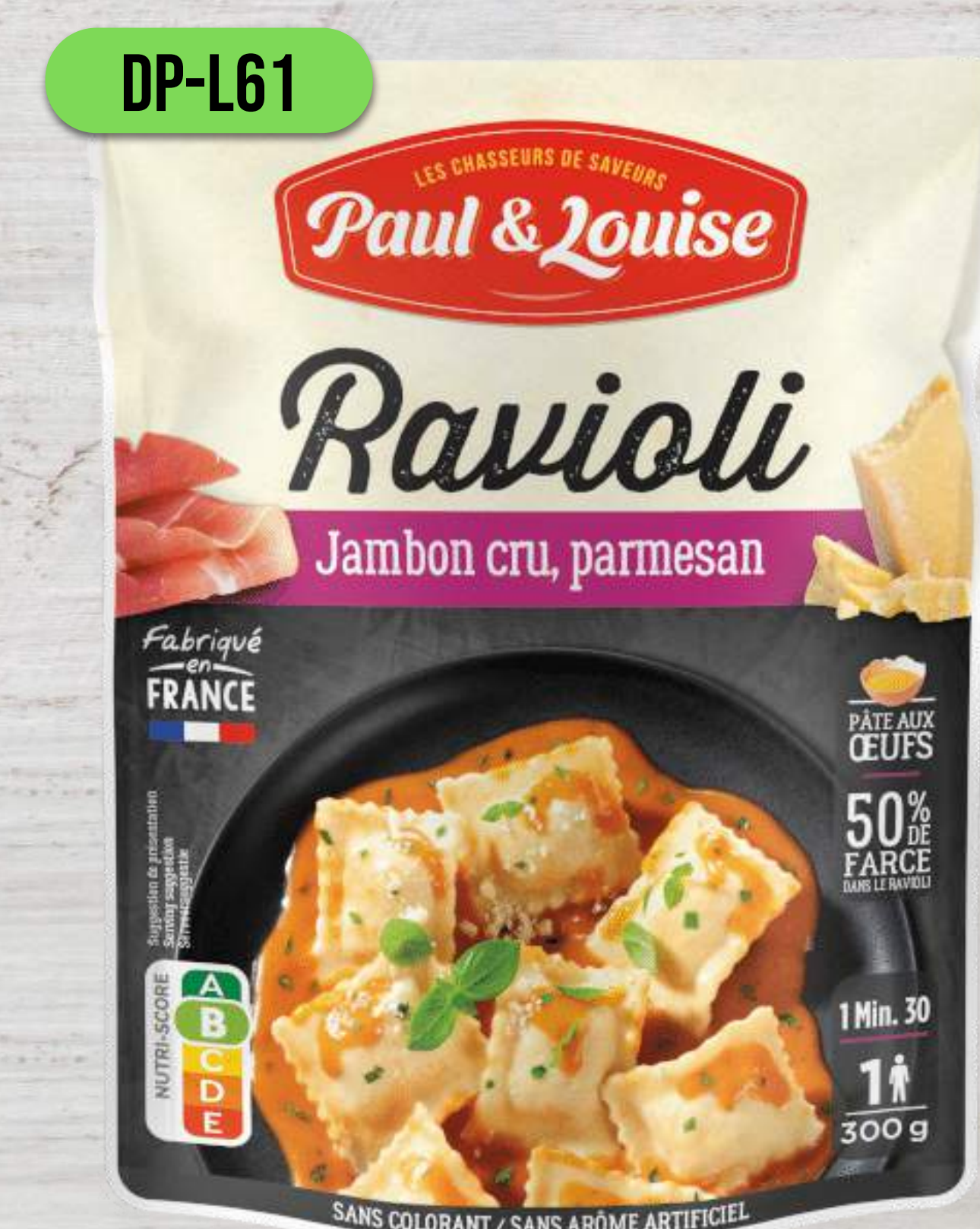
RAVIOLI SO ŠUNKOU A PARMEZÁNOM