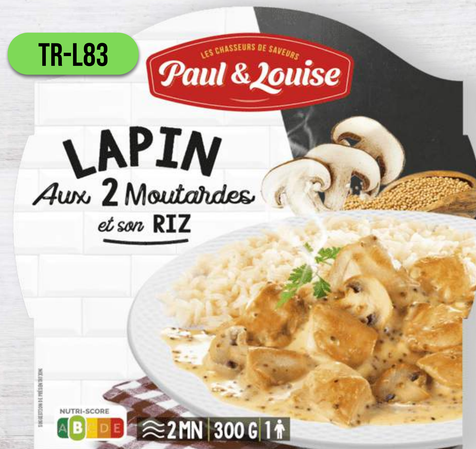
KRÁLIK S HORČICOVOU OMÁČKOU A RYŽOU