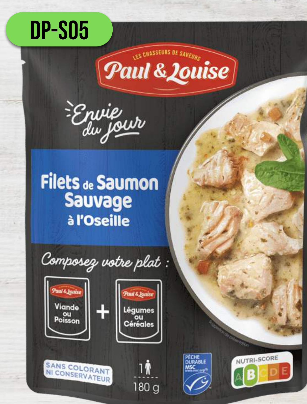
FILET Z DIVOKÉHO LOSOSA SO ŠTAVELOM