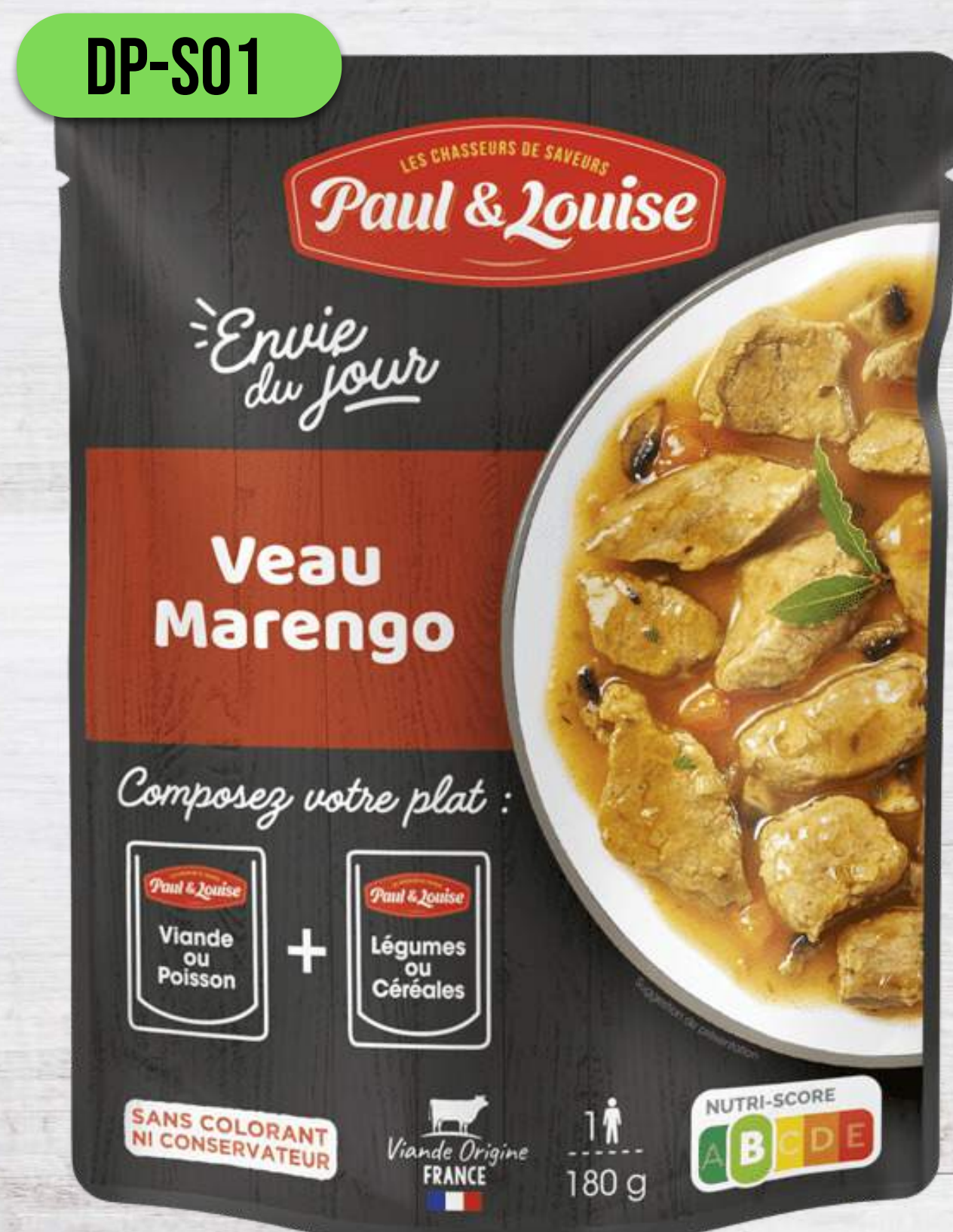
TEĽACIE S HRÍBKMI A ZELENINOU NA SPÔSOB MARENGO