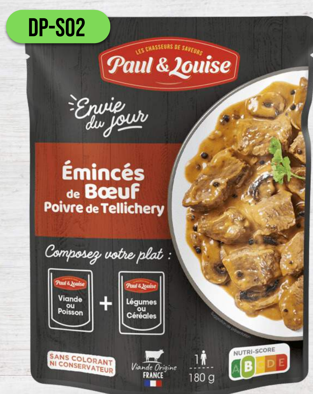
HOVÄDZIE S HUBAMI A ČIERNYM KORENÍM TELlichERY

DOYPACK VRECKÁ 180G + 180G DO MIKROVLNKY AJ DO HRNCA