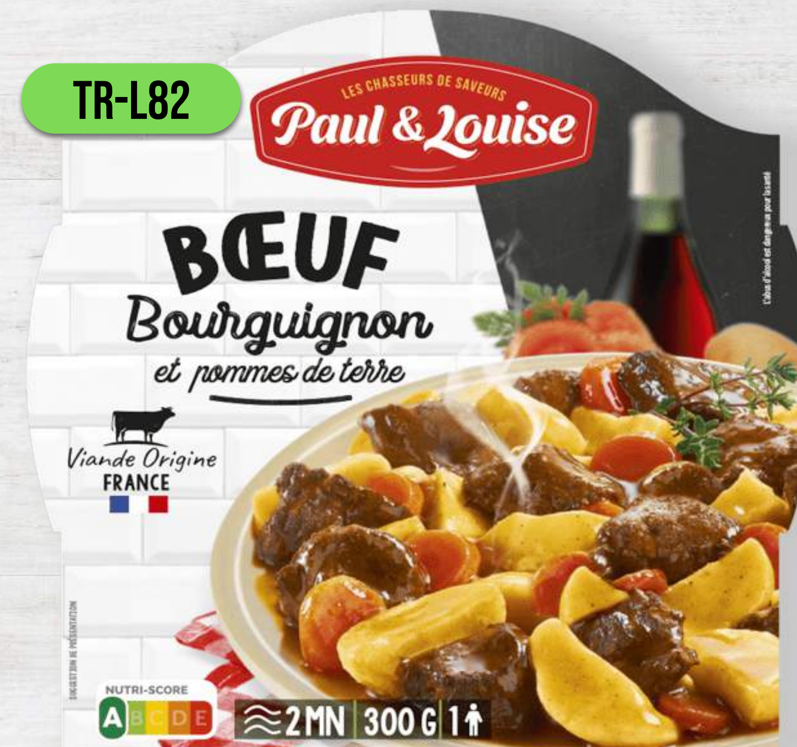
HOVÄDZIE PO BURGUNDSKY SO ZEMIAKMI